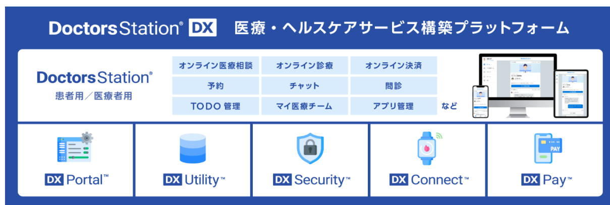
図) 医療・ヘルスケアサービス構築プラットフォーム Doctors Station® DX の構成要素